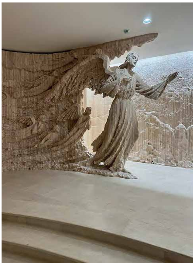
Kapela hrvatskih svetaca i blaženika, Anđeo i anđeoski zbor (detalj), Betlehem, 2025.