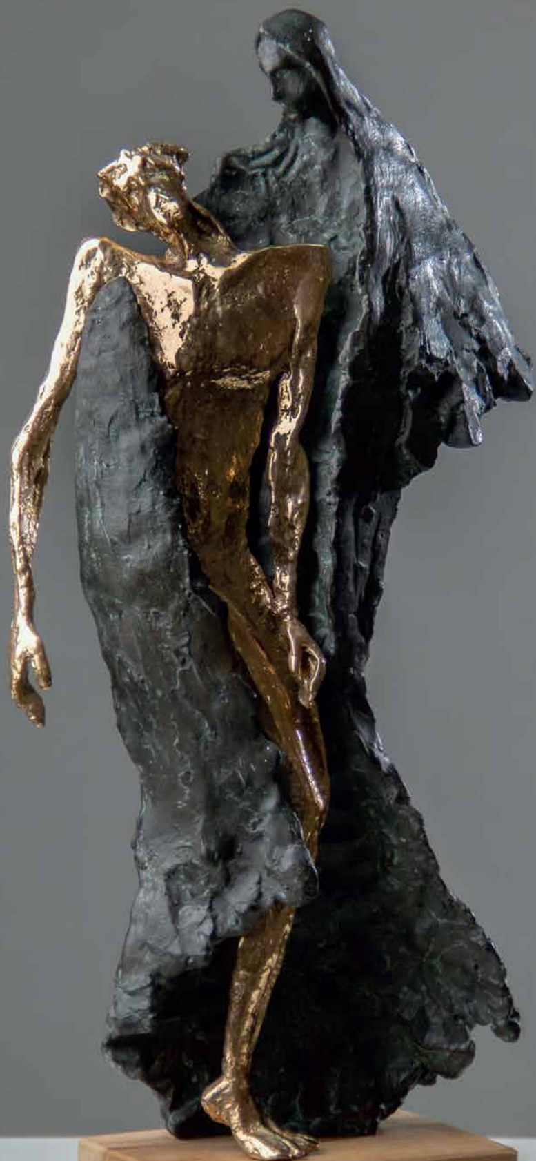
Pieta, 2015 patinirani gips, zlatna boja; 37 x 20 x 8 cm

Salivena u broncu visine 204 cm skulptura čini Spomenik žrtvama ratova i poraća u 20. st. iz mjesta Donji Mali Ograđenik. Postavljen je na mjesnom Dugandžića groblju.