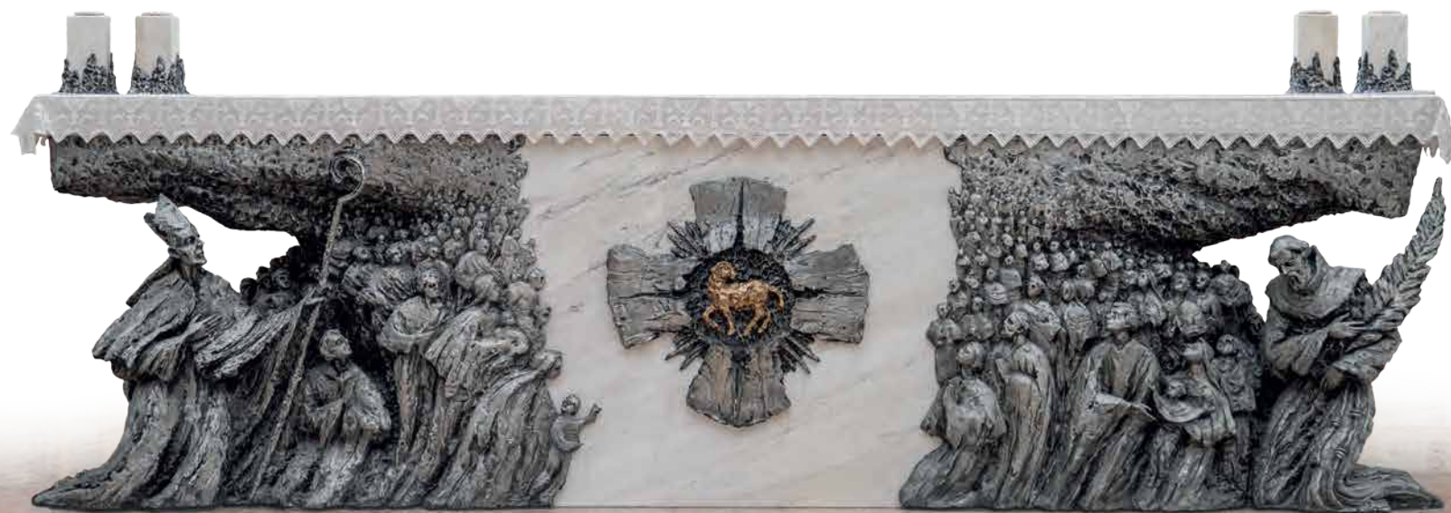
Oltar u novoj župnoj crkvi sv. Ante Padovanskog, Humac, 2020.