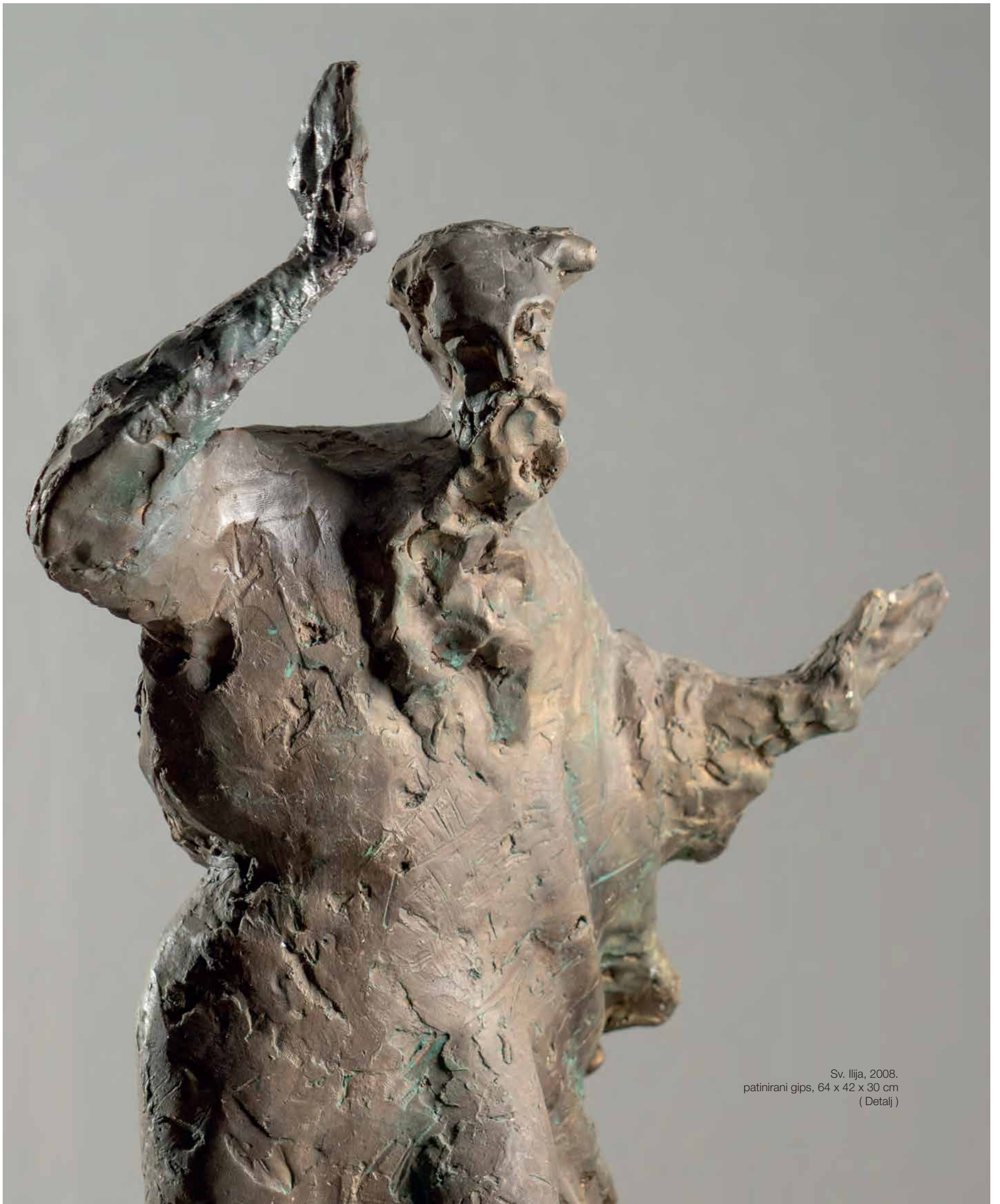
Sv. Ilija, 2008. patinirani gips, 64 x 42 x 30 cm ( Detalj )