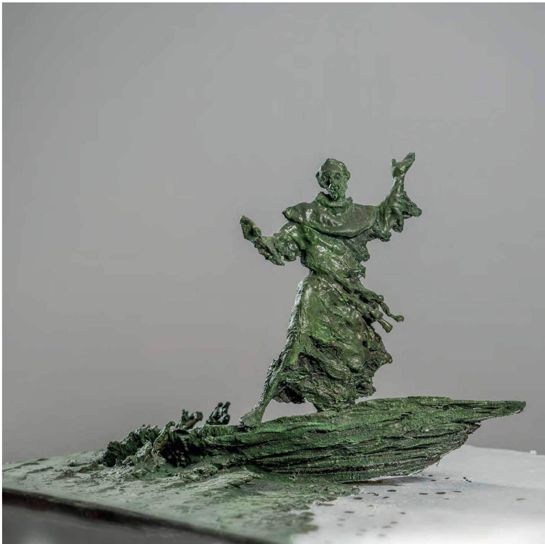
Dolazak Sv. Franje na obalu Jadrana, 2024. patinirani gips, 35 x 60 x 50 cm

Skulptura je studija za spomenik Sv. Franji koji je, prema predaji, zbog „protivnih vjetrova“ tijekom plovidbe u Svetu Zemlju skrenuo na hrvatsku obalu Jadrana. Spomenik podižu zadarski fratri i biti će postavljen ispred samostana sv. Frane u Zadru.