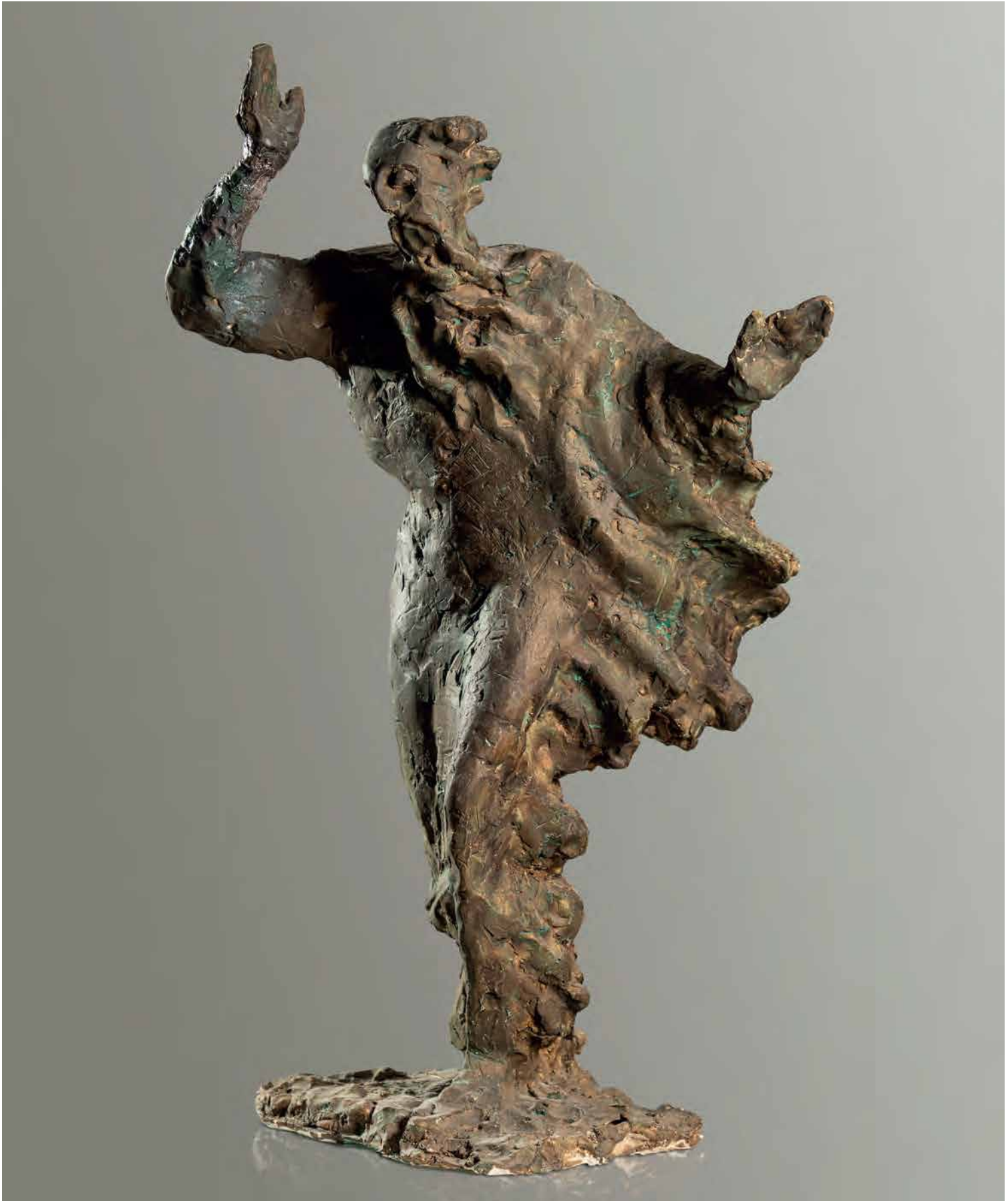
Sv. Ilija, 2008. patinirani gips, 64 x 42 x 30 cm

Skulptura posvećena starozavjetnom proroku, Sv. Iliji Gromovniku, kiparov je hommage svecu priraslom njegovu srcu i kiparskom dlijetu.