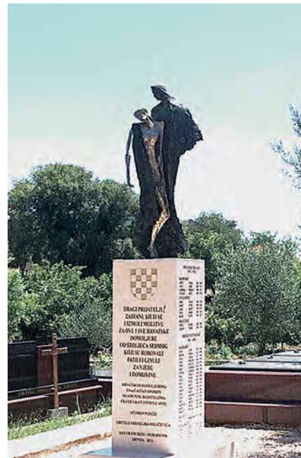
Pietà, Spomenik ratnim i poratnim žrtvama u 20. stoljeću iz mjesta Donji Mali Ograđenik, Dugandžića groblje kraj Čitluka, 2015.

Među brojnijim i sveprisutnijim kiparovim ostvarenjima u crkvama i samostanima autorovu prokreativnu kiparsku osobnost najbolje očituju, vratnice i središnji kameni oltar nove župne crkve sv. Ante Padovanskog na Humcu s reljefima salivenima u broncu (2020/2021.) te Križni put i ansambl skulptura iz crkve sv. Ilije u Karmelu izveden u javoru (2019/2020.). U sredini oltara humske crkve je zoomorfni simbol Jaganjca Božjeg, desno je prizor s mnoštvom vjernika predvođenih Sv. Nikolom Tavelićem, a lijevo prizor s mnoštvom vjernika predvođenih Bl. Alojzijem Stepincem. Desna reljefna kompozicija - riječima kipara - predstavlja našu braću i sestre koji su podnijeli mučeništvo u vrijeme turskog zuluma, a lijeva strana braću i sestre mučene i ubijene za vrijeme i nakon Drugog svjetskog rata . Obje grupe prikazane su u klečećem položaju i pogleda usmjerenog prema Jaganjcu Božjem.