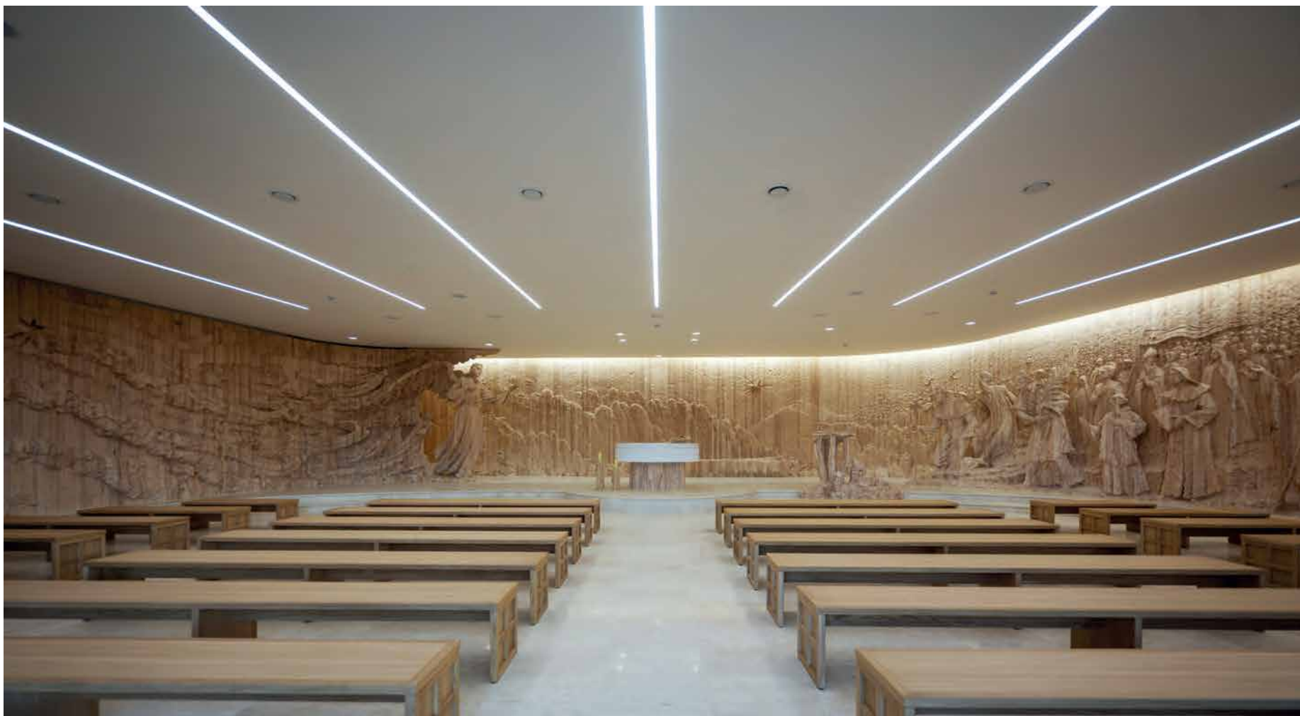
Interijer Kapele hrvatskih svetaca i blaženika s 50 metarskim reljefom, skulpturama svetaca i blaženika, oltarom i ambonom, Svetište sv. Anđela na Pastirskim poljanama, Betlehem, 2025.