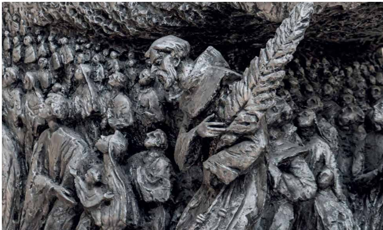
Detalj oltara humske crkve s mnoštvom vjernika predvođenih Sv. Nikolom Tavelićem.

U Karmelu sv. Ilije na obali Buškoga jezera, u tamošnjoj crkvi i samostanskoj kapeli karmelićana, 4 gdje u tišini i sabranosti žive i mole redovnici Braće BDM od gore Karmela, Skočibušić je izveo djelo zamašnih razmjera, svoj prvi total design bogoslužnih prostora. U crkvi i kapeli ostvario je u mliječno bijelom javoru skulpturalne ansamble koji zorno očituju svojevrsnu „kombinatoriku“ stilskih izričaja. S jedne strane je crkva sv. Ilije koja zrači barokiziranom uskovitlanošću gotovo lebdećih figura koje flankiraju njen prezbiterij, a s druge strane je samostanska kapela posvećena Bogorodici u kojoj vladaju blažena mirnoća i meditativno ozračje. U skućenom prostoru prezbiterija kapele je reljef svete Obitelji. Modeliran je melodično izvijenim linijama oko čistih plošnih oblika što nam daje znati da Skočibušiću nisu strani ni estetički purizam niti suvremeni minimalistički izričaji. Ikonografski narativ oba skulpturalna ansambla prožet je kiparovim proćućenim simbolizmom i zanosno koherentnom vizijom sakralnosti, ostvarenoj u sinergiji postmodernističke slobode postupaka i kiparove duhovnosti odnjegovane u okrilju religiozne baštine njegova zavičaja. Zgusnutost i brojnost oblika na jednoj strani (crkva) te linearni asketizam i sažimanje sižea u znakovlja na drugoj strani (kapela) u Skočibušića su jednako vrijedni morfološki postupci i oba suvereno koristi u interesu produbljivanja svoga umjetničkog izričaja.