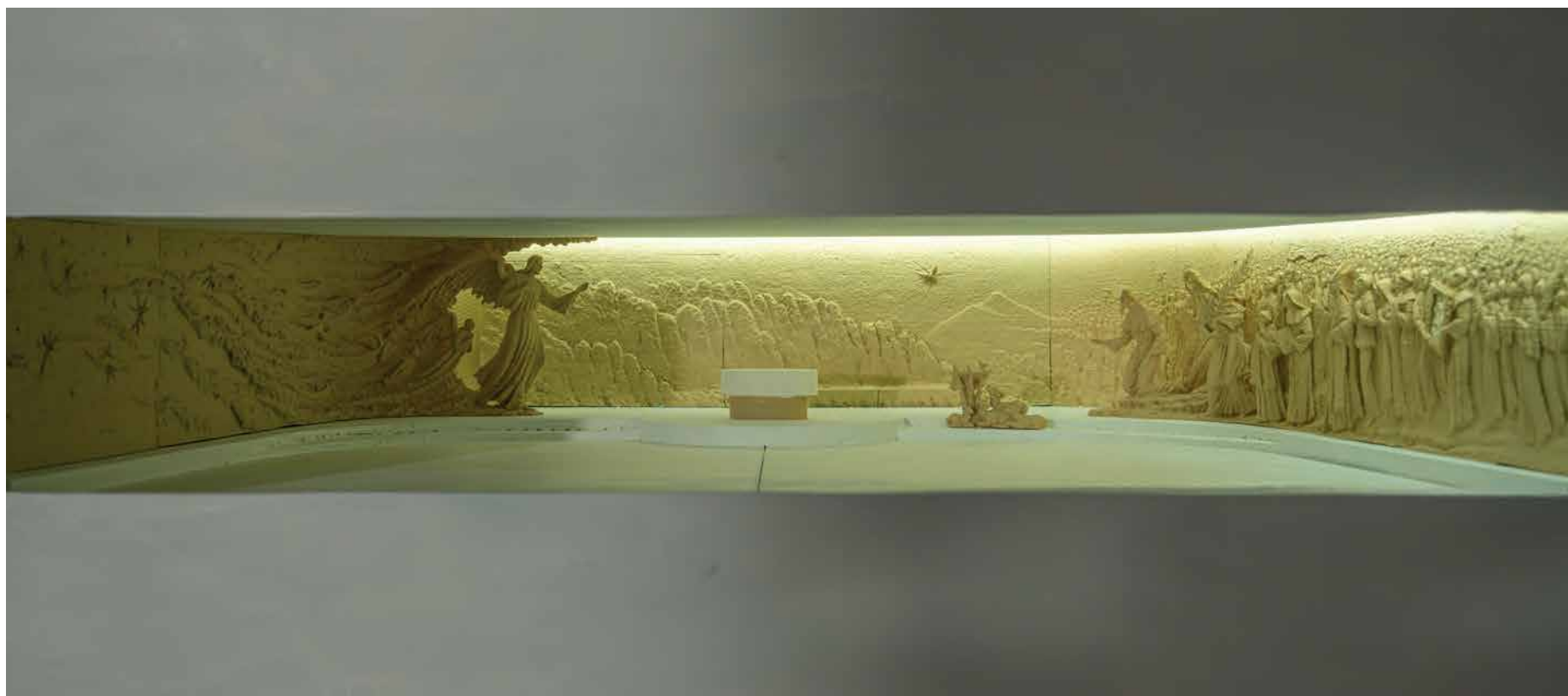
Maketa skulpturalnog ansambla Kapele hrvatskih svetaca i blaženika u Betlehemu, 2025. 3D print u filamentu (reljefi) i stiroduru (maketa), 110 x 100 x 30 cm

Maketa prikazuje kiparovo skulpturalno rješenje interijera Kapele hrvatskih svetaca i blaženika izgrađene na Pastirskim poljanama u Betlehemu. Svečanim liturgijskim obredom Kapela je blagoslovljena i otvorena hodočasniciima u Svetu Zemlju 2. ožujka 2025.