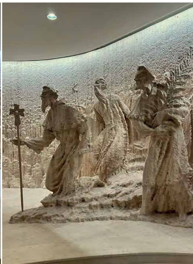
Kapela hrvatskih svetaca i blaženika, Sv. Nikola Tavelić, Sv. Jeronim Dalmatinac i Sv. Marko Križevčanin, Betlehem, 2025.