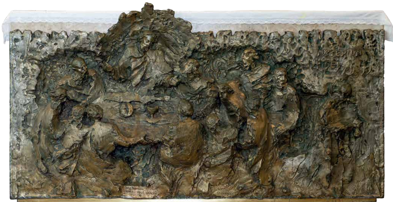
Posljednja večera, antependij oltara u župnoj crkvi sv. Ilije Proroka, Masna Luka na Blidinju, 2004.