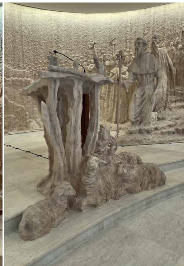
Kapela hrvatskih svetaca i blaženika, Ambon, Betlehem, 2025.

Odmah nam je reći da se ovaj ansambl u cjelini odlikuje ne samo umjetnikovom fascinantnom kiparskom vizijom svetosti i primjerenom morfološkom gradacijom njezina značaja za hodočasnički puk u Svetu Zemlju, nego i s prelijepom sraslosti svijetlog javorova drva s modernim zdanjem same kapele. Cijeli taj velebni sklop - sazdan od: monumentalnog polukružnog reljefa dugog 50 m i visokog 3,5 m obavija prezbiterij kapele u središtu kojeg su minimalistički modelirani oltar i figuralni ambon koji asocira na jaslje. S lijeve strane prezbiterija u prostor izlazi skulptura anđela s anđeoskim zborom u pozadini. S desne strane u prostor prodiru skulpture svetaca, Nikole Tavelića, Jeronima Dalmatinca, Leopolda Mandića i Marka Križevčanina iza kojih stoje blaženice/i modelirani u visokom reljefu; od Alojzija Stepinca, Augustina Kažotića i Miroslava Bulešića do Ozane Kotorske, Marije Propetog Isusa Petković i kraljice Katarine Kosača s još devet beatificiranih pripadnika hrvatskog naroda.