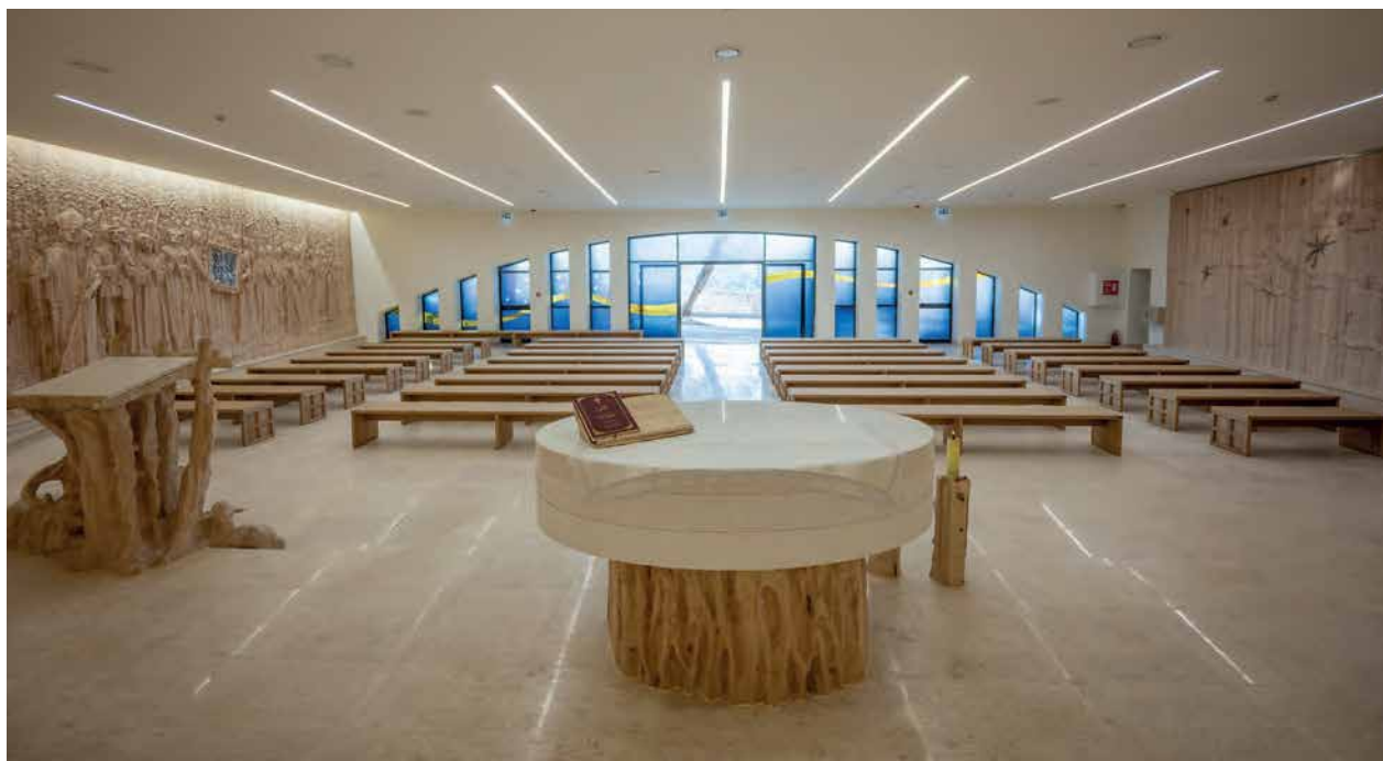
Interijer Kapele hrvatskih svetaca i blaženika, pogled prema ulazu, Betlehem, 2005.

Preostaje nam predstaviti najsvježije Skočibušićevo djelo, grandiozno u doslovnom i prenesenom smislu. Riječ je o 50 metarskom skulpturalnom ansamblu izvedenom u Kapeli hrvatskih svetaca i blaženika u Betlehemu. Javnosti i mnogobrojnim hodočasniciima u Svetu Zemlju predstavljeno je 12. ožujka 2025., a mi ga na izložbi predstavljamo u znatno umanjenoj, ali i maksimalno preciznoj maketi koju je autor načinio u 3D printu.