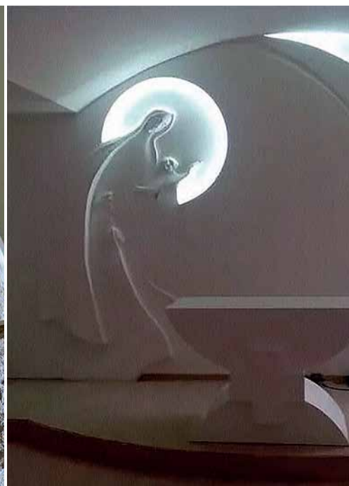
Prezbitterij samostanske kapelice u Karmelu sv. Ilije na obali Buškog jezera, 2020.

Još je cijeli niz odličnih Škočibušićevih skulpturalno-dizajnerskih ostvarenja koja oplemenjuju crkve i samostane u Hercegovini pa i u Hrvatskoj. Primjerice, u Kapeli-svetištu Kraljice Sv. Krunice pri dominikanskom samostanu na zagrebačkom Borongaju minimalistički je uredio cijeli interijer pa je ozračje meditativno i svu pozornost promatrača plijene oltar i ambon bogato urešeni skulpturama. Pojedinačnih skulptura, oltara, ambona, svetohraništa i naročito crkvenih vratnica u Škočibušića također je zamašni broj. Sva su ta djela, razumije se, ugrađena u crkvena zdanja i nije ih bilo moguće dovesti u Čaplinju pa smo posegnuli za fotografskim uvećanjima koja prezentiraju pet kiparovih sjajnih crkvenih vratnica izvedenih u raznim tvorivima, od bronce i aluminija do javorova drva. Poblže rečeno od onih ranih brončanih, izvedenih za franjevačke crkve u Masnoj Luci (2004.) i Kruševu (2010.) posvećenih Sv. Iliji, pa brončanih vratnica za staru (2010.) i četvero-krilnih aluminijevskih za novu crkvu na Humcu (2021.) posvećenih Sv. Anti Padovanskom do prelijepih javorovih vrata s portalom izvedenih za kapelu u samostanu na Širokom Brijegu (2024.) te na koncu do fascinantnih vratnica s prizorom Kristova Uskrsnuća izvedenih u aluminiju za crkvu hercegovačkih franjevaca u zagrebačkoj Dubravi. S potonjim Škočibušićevim vratnicama smisao Isusove muke i pasionski temat izložbe zadobili su vrhunarnogvog interpreta.