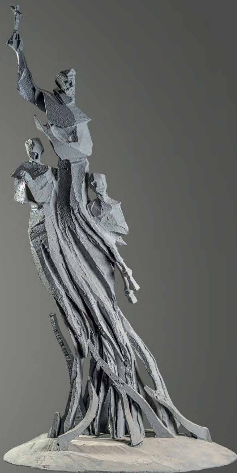
Studija za skulpturu Sv. Nikola Tavelić i subraća, 2023. stiropor, 110 x 55 x 37 cm

Prvog hrvatskog kanoniziranog sveca, koji je s franjevačkom braćom propovijedao Evanđelje i u Hercegovini, kipar je modelirao za crkvu sv. Ivana Krstitelja u Biogradu na Moru.